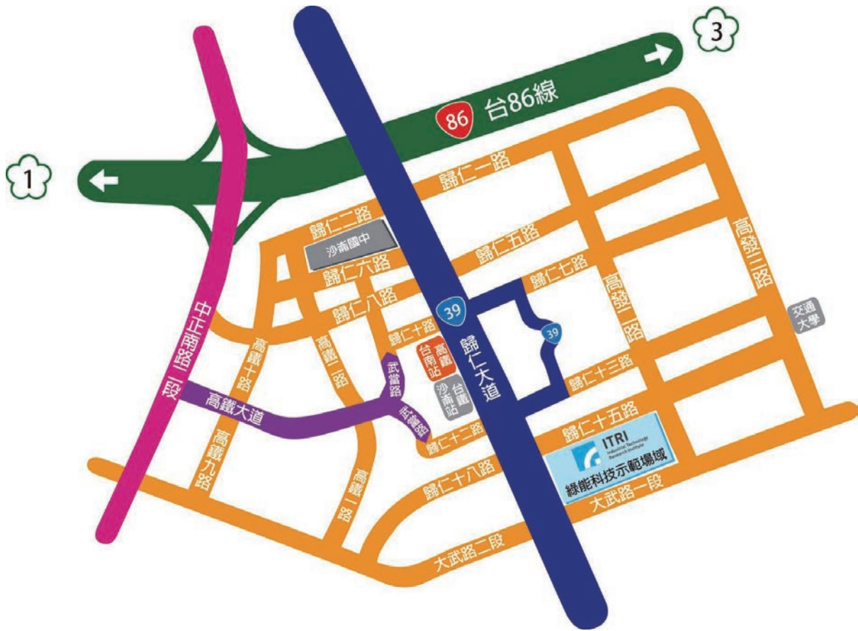
往工研院沙崙辦公室路線圖